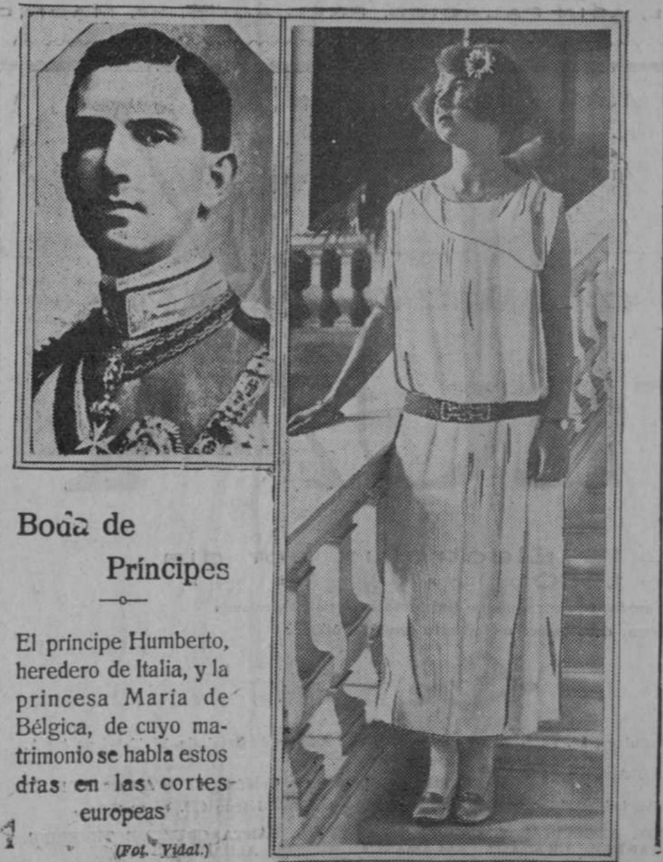
Boa de Principes

El príncipe Humberto, heredero de Italia, y la princesa Maria de Bélgica, de cuyo matrimonio se habla estos días en las cortes europeas