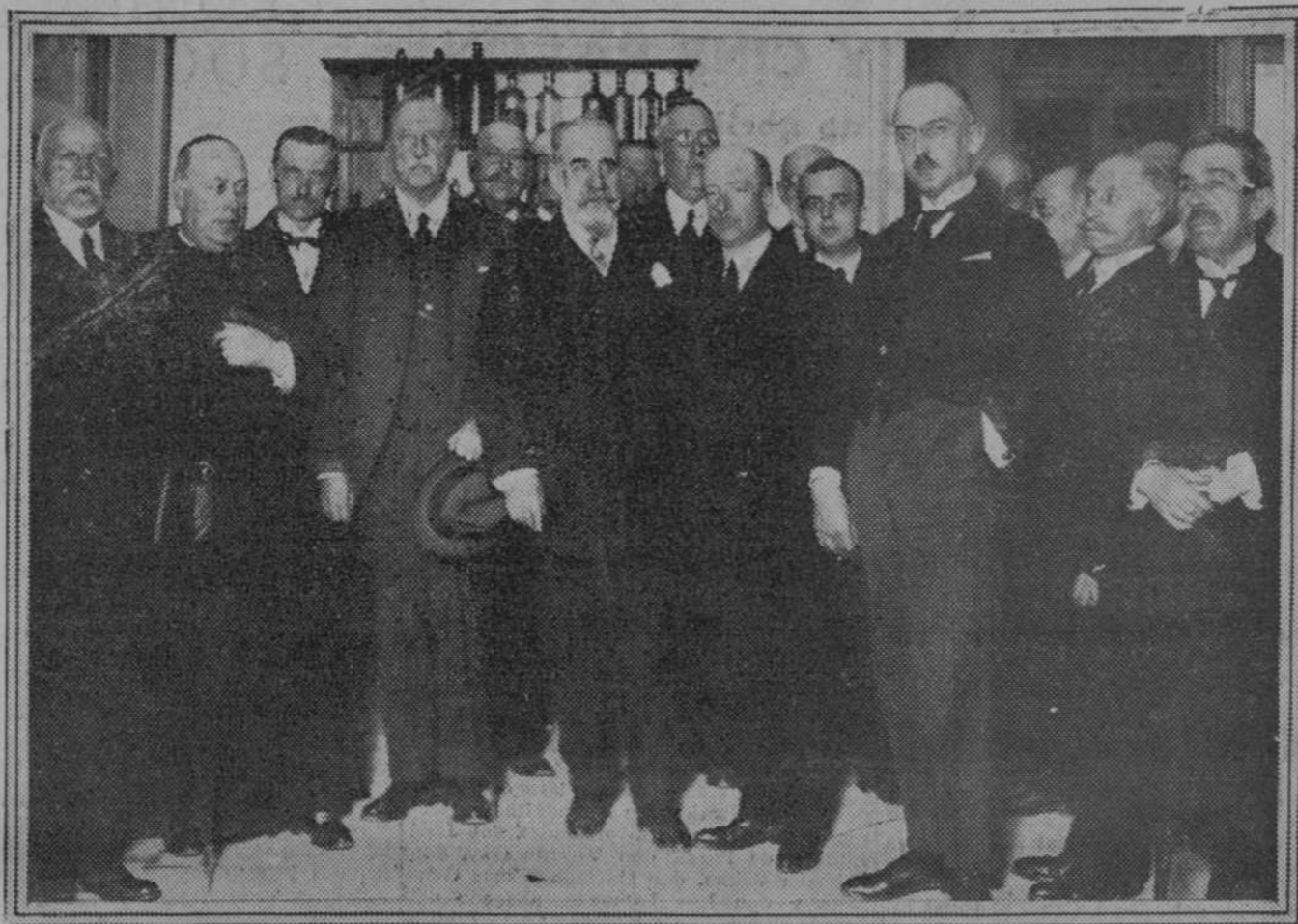
El ministro de Instrucción pública, señor Callejo, y el director general del Instituto, señor Elola, con los delegados extranjeros de las Sociedades Geográficas y los miembros de las españolas, que ayer visitaron los talleres del Instituto Geográfico y Estadístico