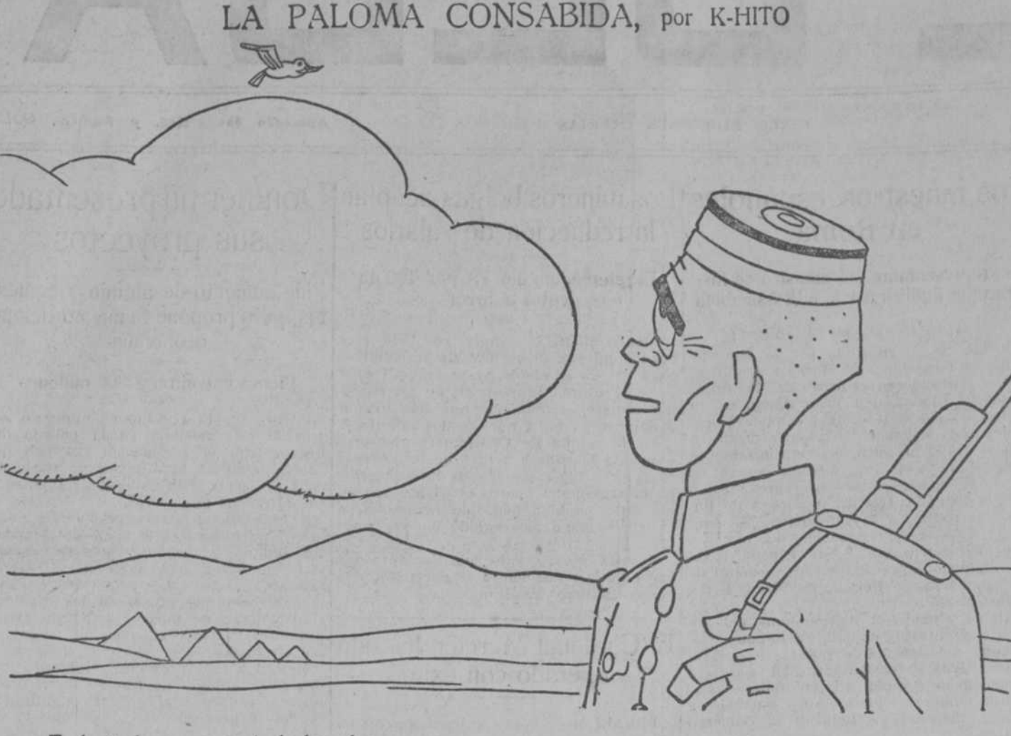
—Todavía hay que cortar las alas.

Según participó ayer la Comisaría de Vigilancia de la estación de correo de la Dirección de Seguridad, el correo de Extremadura, que tiene su llegada a las nueve treinta, llegó a las tres, por haber descarrilado un tren de mercancías entre las estaciones de Guadalupe y Pedroches.