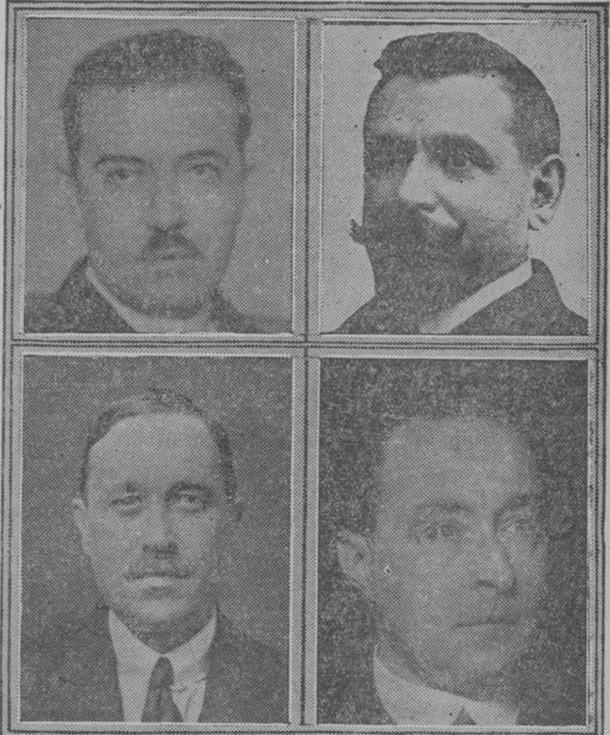
Arriba: Los señores González Oliveros y Suárez Somonte. Abajo: Los señores Prado y Vellando