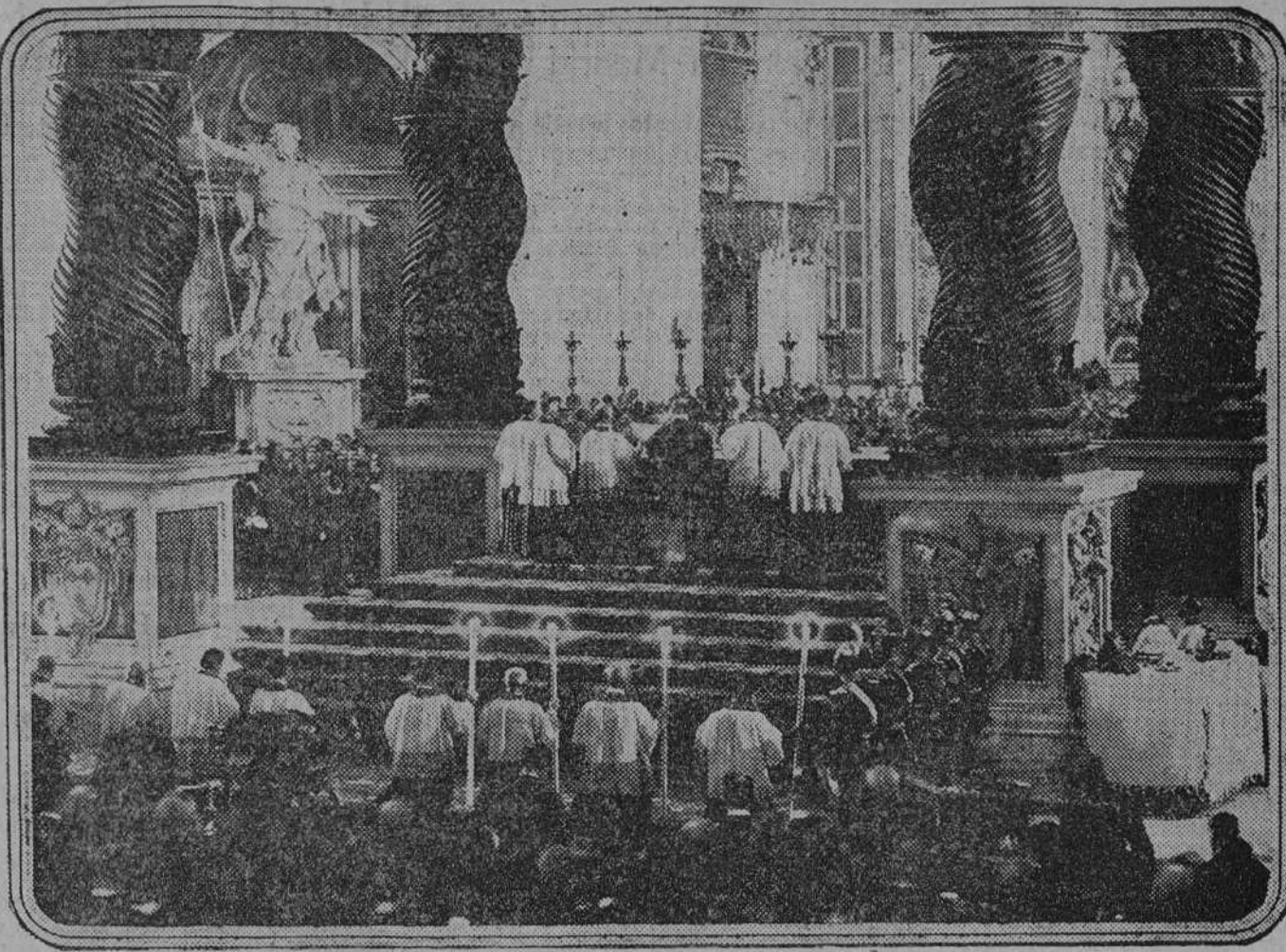
Su Santidad Pio XI diciendo misa en el altar mayor de San Pedro, ante una peregrinación del Año Santo.