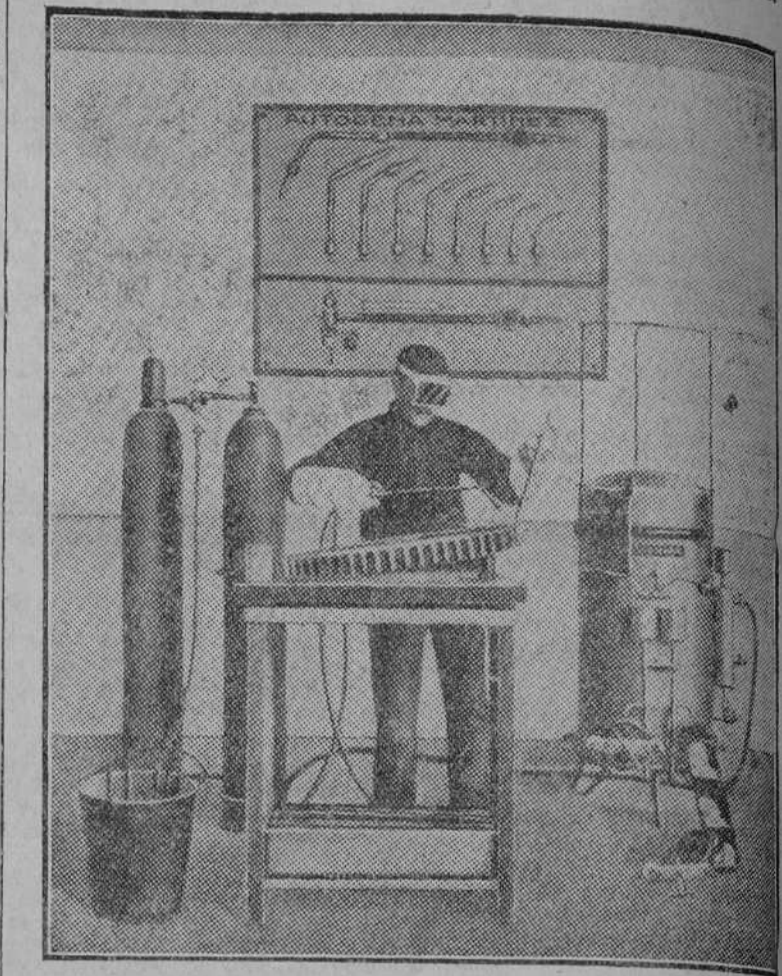
Manipulación de la soldadura «Autógena Martínez»

Ha sido el stand de «Autógena Martínez» uno de los que más favorecidos de público se han visto durante todos los días que ha durado la Exposición.