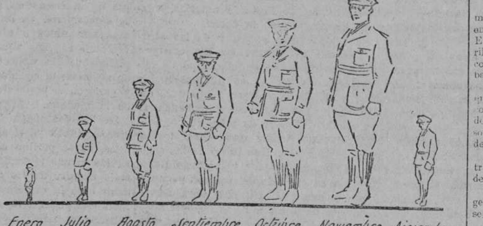
Gráfico del movimiento de fuerzas en Africa durante el año 1924

«Lo mismo que el año pasado» Con la sonora fiesta popular de todos los años fué despedido anoche el 1924. Las gaitas, provistas de zambombas, panderos, latas y demás artefactos, hicieron irrupción en la Puerta del Sol, saludando al mayor ruido posible la entrada de año 1925. La bola del reloj de Gobernación, iluminada con bombillas rojas, cayó a las doce en punto, anunciando el criterio tradicional. Encima de la torre, iluminada de amarillo, apareció en 1925, que fué saludada con vivas, aplausos y estrepitos de jazz-bands completamente perturbado. Las gentes, divididas en dos bandos, los que amaban bulla y los que no podían conciliar el sueño por la bulla misma, se dejaron desde entonces a hacer palizas sobre lo que les separará el nuevo vestigio del tiempo. Durante la madrugada los grupos extruendosos prosiguieron sus excursionaciones, derrochando vino y agüra. Una curules armó un escándalo, que degeneró en bronca. A grandes voces y por pedido de bulice cambasano, gritó: «Lo mismo que el año pasado!» Y cuando los guardianes le hicieron a la Comisaría, cambió de diálogo: «era no de convento, y muy bonito, mestizado». «¡Lo mismo que el año pasado!»