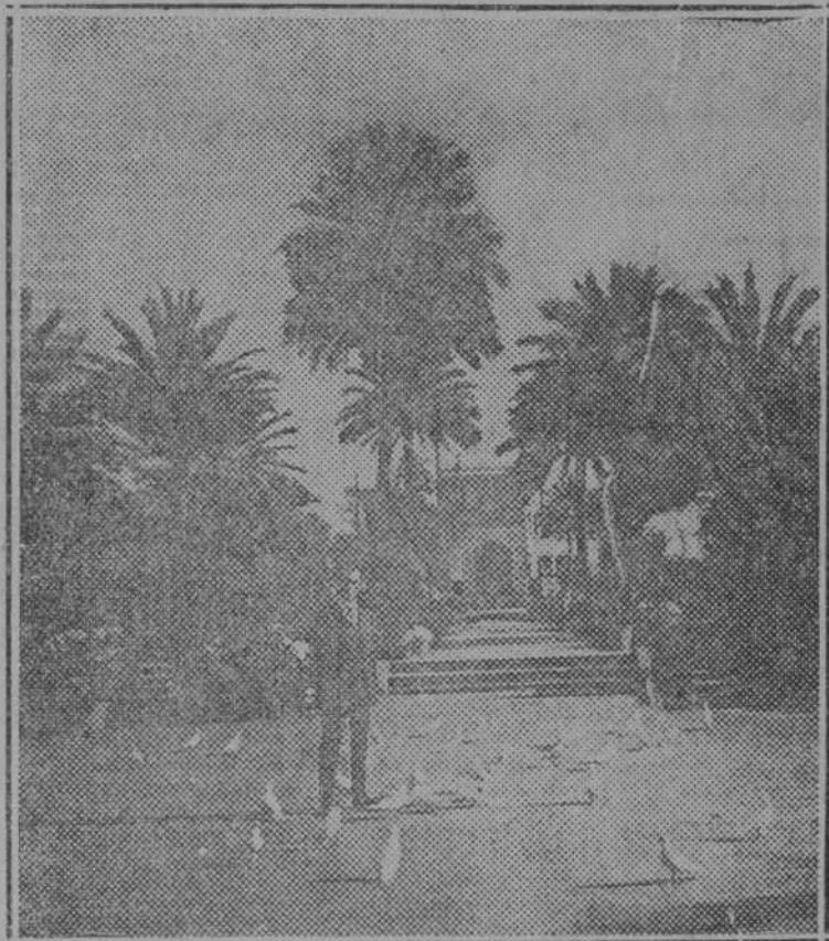
Exposición Hispano-Americana.—Plaza de América.