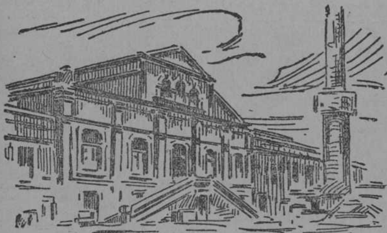
Vista de la fábrica

Para todo viajero que al visitar Andalucía se halle imbuido de la absurda leyenda que perniciosamente ha contribuido a crearle un ambiente de país en que tan sólo impera el vino y los toros, la guitarra y el cantar flamenco, le está reservada una profunda sorpresa. Sevilla es la demostración plena de que en Andalucía se trabaja,