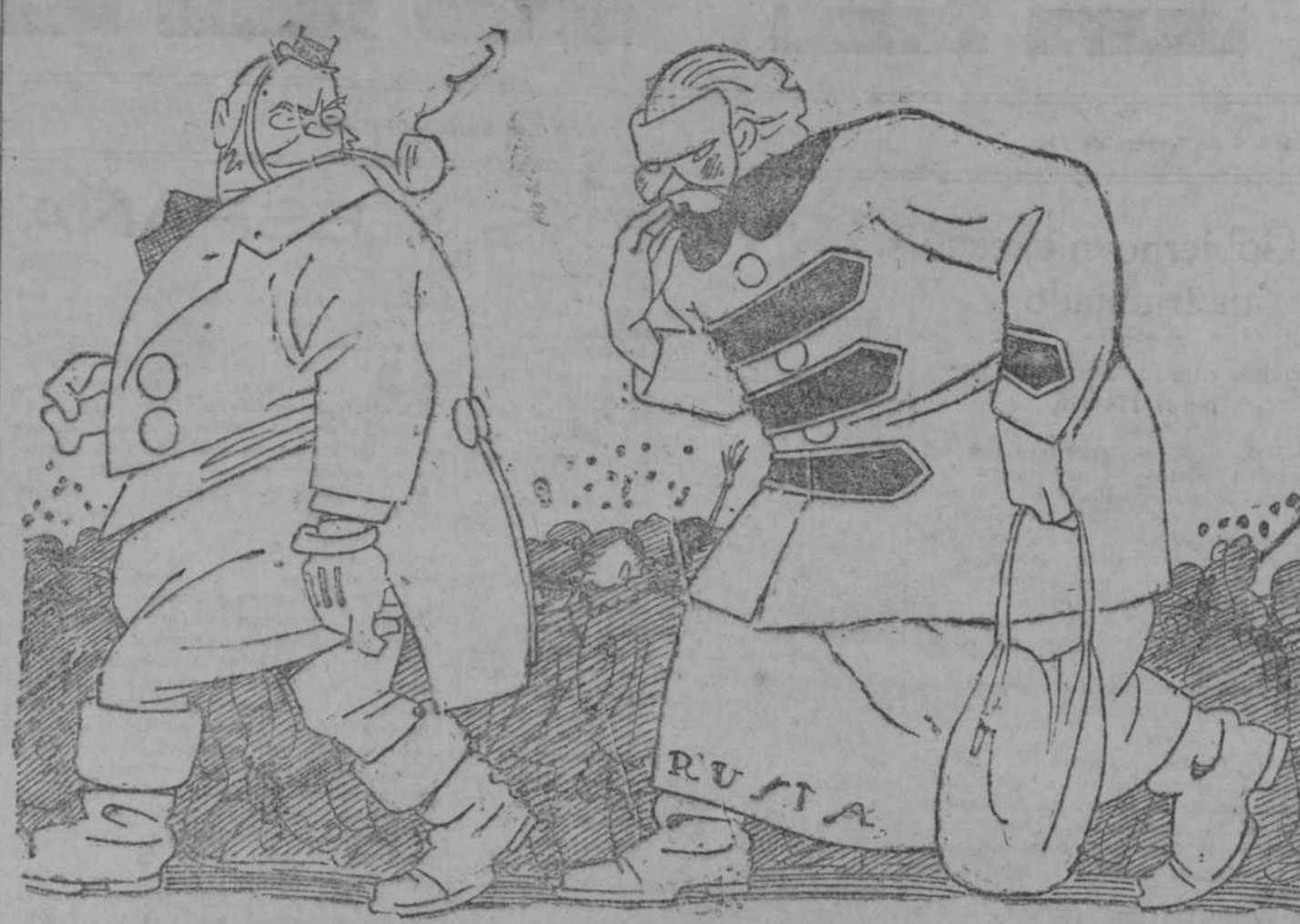
¿Me reconoces? ¿Me reconoces?