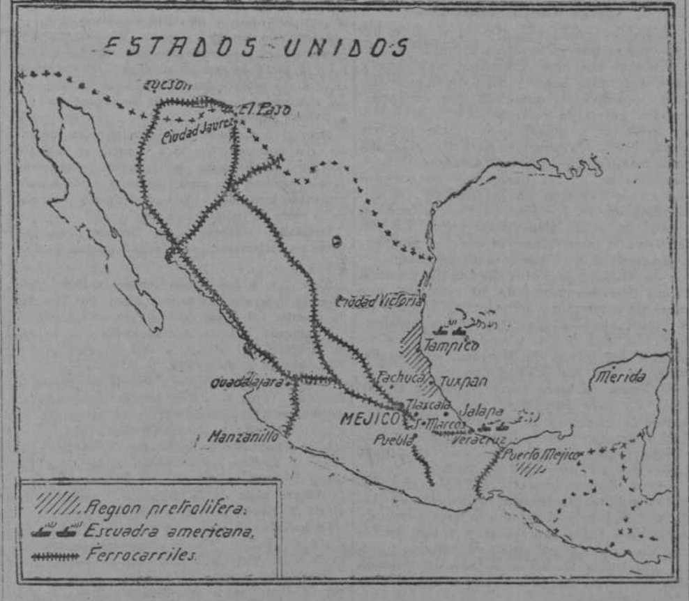
Las últimas noticias de Méjico acusan una victoria del general Obregón en Ciudad Victoria y una rebelión en Guadalajara...