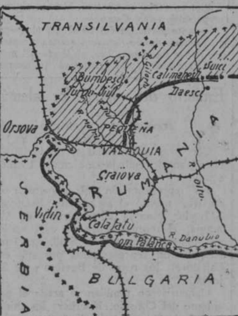
Map showing the location of Craiova and surrounding regions in Rumania, including Transilvania, Bulgaria, and parts of Prusia and Polonia.

dad, bajo la dirección del Estado, al servicio del Estado y por cuenta del Estado, van a realizar el último esfuerzo para la guerra... ¡en Alemania! Pero no desesperemos; es cierto que nosotros llegaremos a eso... después... como siempre... ¿No somos nosotros gentes de iniciativa? ¡Callen, señores, callen!... Callen, por Dios, que ya verán cómo si no ca-