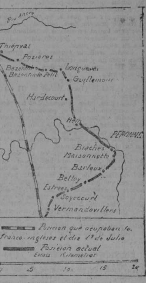
Posición que ocupaban los franco-ingleses el día 14 de Julio