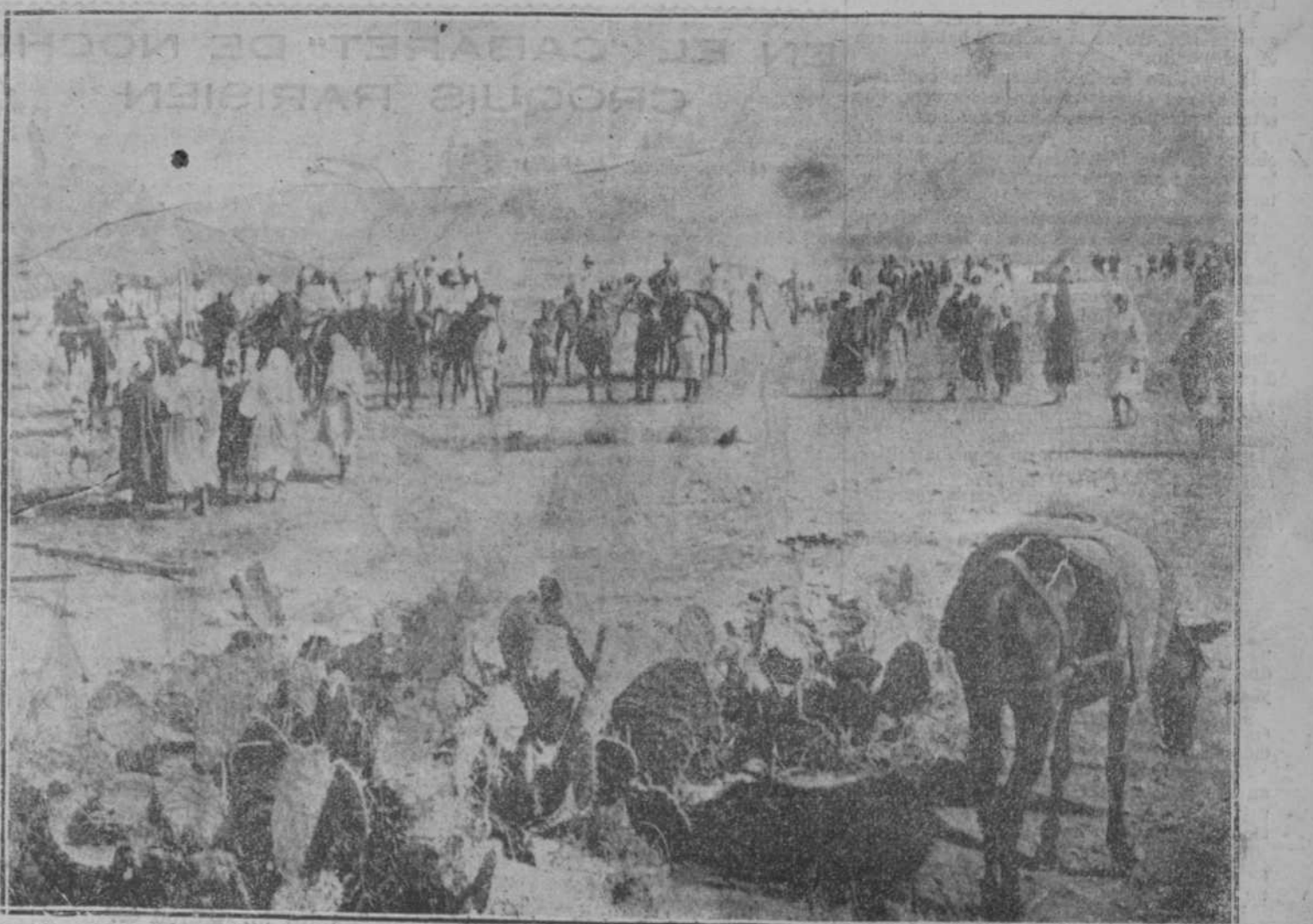
Nuevo zoco en Beni-Sidel, inaugurado el lunes por el capitán general de Melilla. Se iba para del Tinain de Tejat.