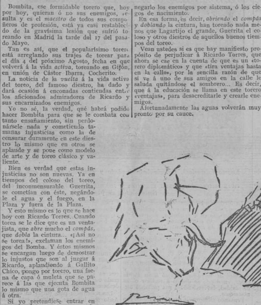
Bombita torcando de muleta.