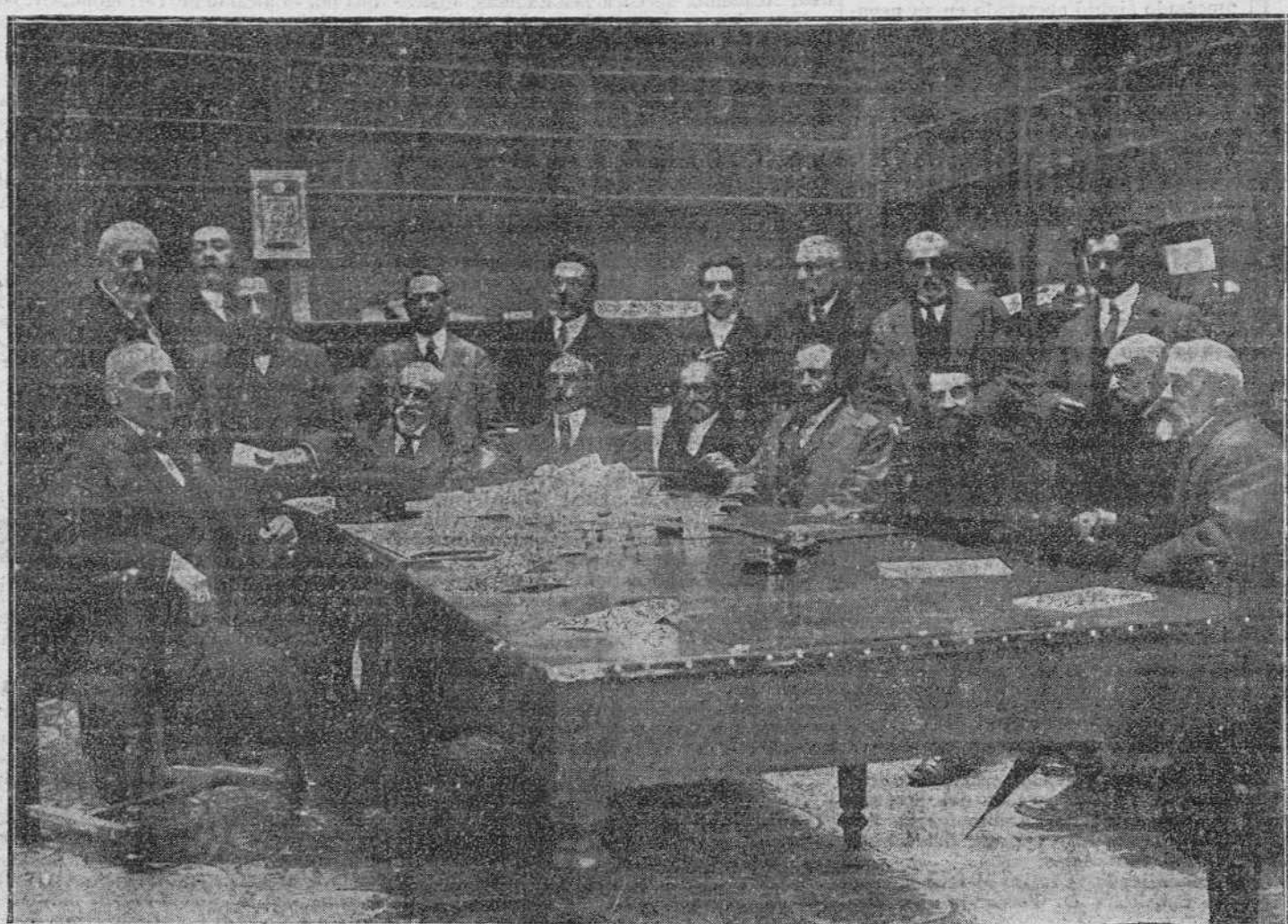
CONSTITUCIÓN DEL JURADO BLEGIDO PARA LA PRÓXIMA EXPOSICIÓN DE BELLAS ARTES