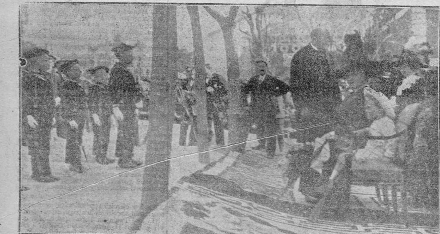
La Reina doña Victoria y S. A. el Principe de Asturias, presenciando las manobras que ejecutó ayer el batallón infantil, en el asilo de Santa Cristina.

Publicados é no, no se devuelven originales. Los que envían original sin contratar antes con la Empresa del periódico, se entienden que solicitan la inserción gratuita.