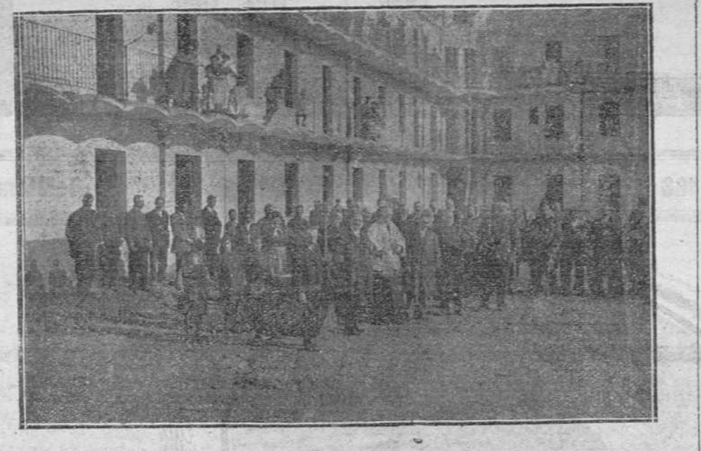
BENDICIÓN DEL CUARTEL DE LA GUARDIA CIVIL DE TARRASA, A CUYOS GASTOS DE CONSTRUCCION HAN CONTRIBUIDO LOS FABRICANTES DEL PUEBLO