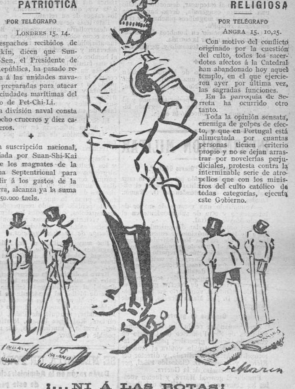
...NI Á LAS BOTAS!