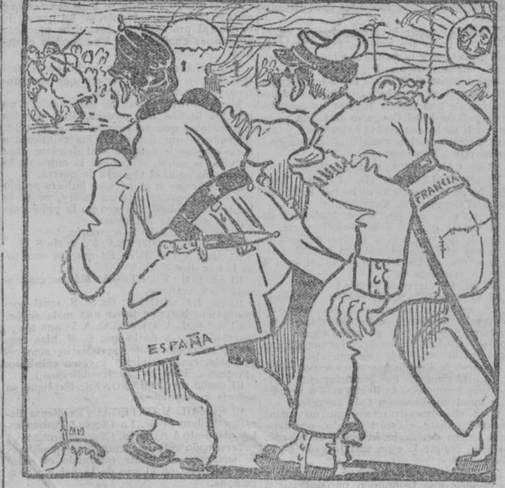
EL FRANCÉS.—Allí se pegan de firme; ¡corramos! EL ESPAÑOL.—Si, corramos; pero me "pa" que to vas "cuando" atrás.