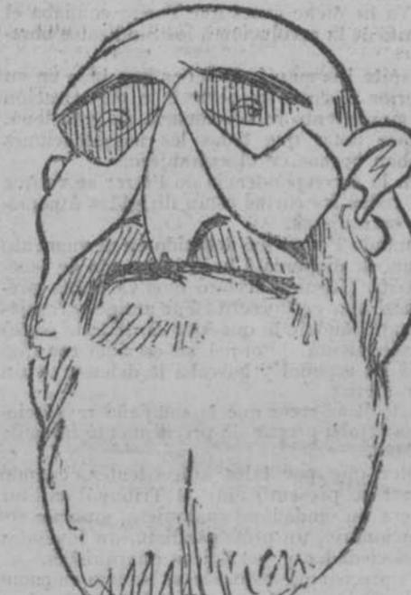
ANTONIO BARROSO. Ministro de Gracia y Justicia.

¿Por qué esa burla inferida á la Patria con la superchería de un adiós imposible? ¿Por qué ese trasiego de caras sin cambio de orientación? Eso, que era lo único que debía decir Canalejas, tuvo á bien callárselo.