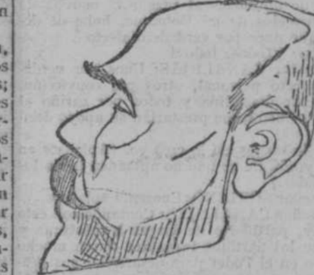
TIRSO RODRIGUEZ. Ministro de Hacienda.

«Dichosa edad y siglos dichosos aquellos a los que los antiguos pusieron nombre de dorados, y no porque en ellos el oro, que en esta nuestra Edad de Hierro tanto se estima, se alcanzara en aquella venturosa sin fatiga alguna, sino porque entonces los que en ella vivían ignoraban estas dos palabras de tuyo y mío.»