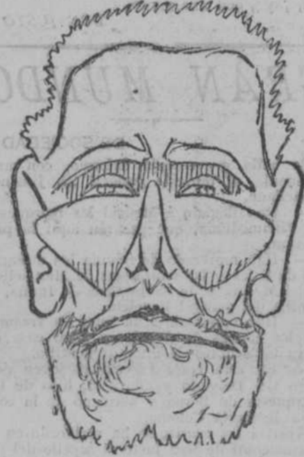
GENERAL LUQUE. Ministro de la Guerra.

La crueldad es un gravísimo mal que ha echado hondos raíces en el mundo. Por cualquier lugar que recorramos nos asalta ineluctable y desgraciada una inmensa crueldad.