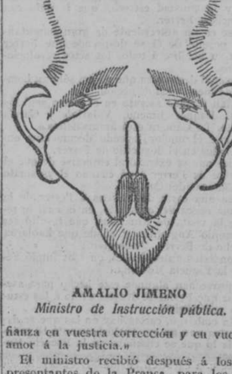
AMALIO JIMENO. Ministro de Instrucción pública.

Si el único de Voltaire hubiera vivido siglos antes y enderezado a su doctor Panglós por tales derroteros tropicales, el optimismo de este personaje hubiera dado quince y raya al desenlace de todos los libros de Caballería.