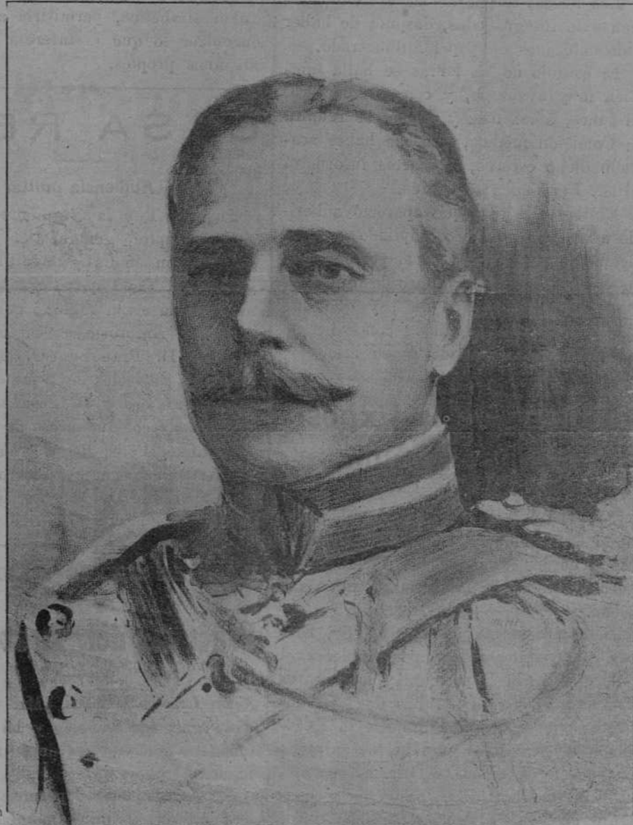
El insigne caudillo, mariscal inglés, Sir Douglas Haig, héroe popular recientemente fallecido, y que en los días trágicos de la pasada gran guerra adquirió legítima fama y renombre universal