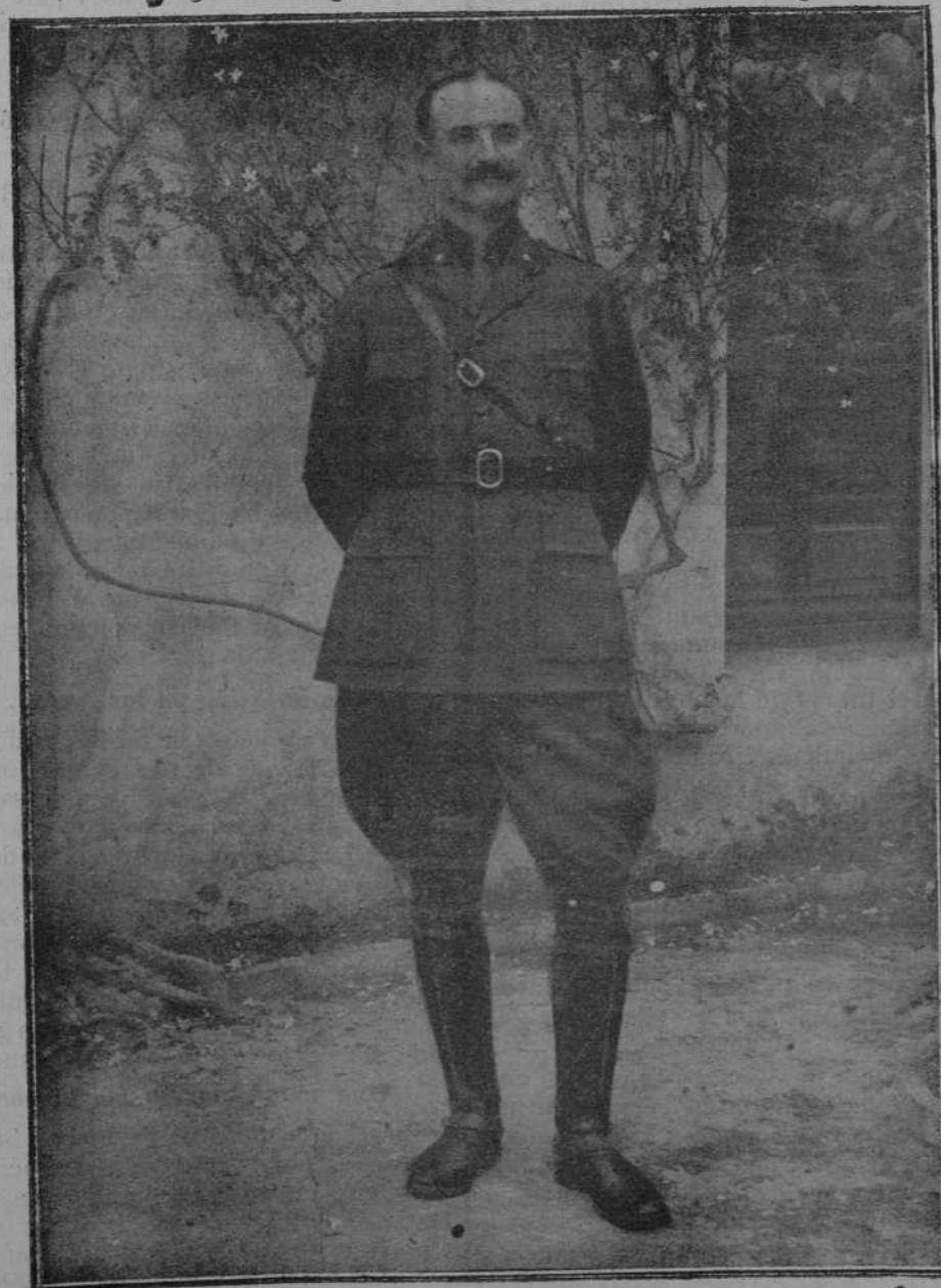
El general de brigada don Gonzalo Queipo de Llano, gobernador militar de Córdoba.