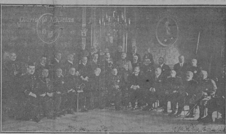
El capitán general de Cataluña, don Emilio Barrera, con los nuevos gentileshombres, a quienes tomó juramento