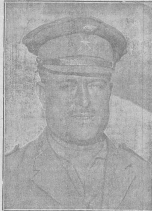
El bizarro general Serrano, muerto por un "paco" en Xackan Xeruta