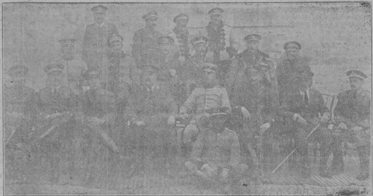
Grupo de jefes y oficiales del Regimiento de Cazadores de Albuera

En política se distinguió siempre por sus ideas liberales y monárquicas. Ha representado en Cortes los distritos de Vélez-Málaga, Campillos y Jerez de la Frontera. Ha sido gobernador civil de las provincias de Lérida, Alava, Avila y Murcia. Sus discursos en el Parlamento fueron muy notables y es hoy considerado como uno de los primeros oradores de la España actual.