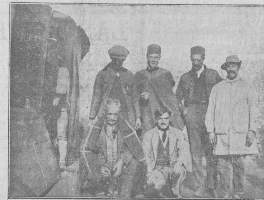
Cantinero prisionero de Abd-el-Krim, después de su rescate.

de ellos con todos los miembros rotos y en estado agónico.