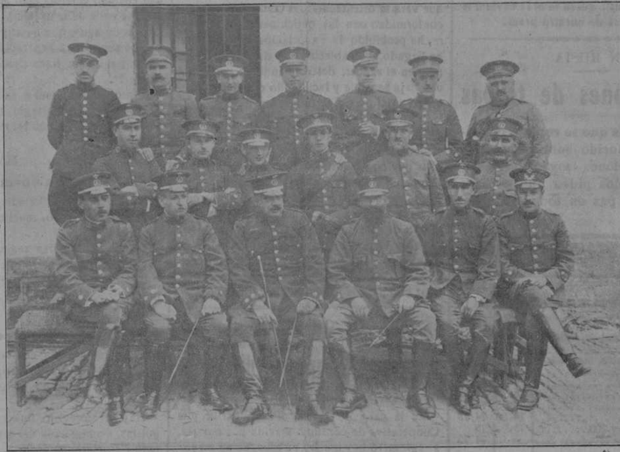
Grupo de jefes y oficiales del Regimiento de Almansa

Los ilustres viajeros están satisfechísimos por el grandioso recibimiento que les ha hecho la población entera de Tenerife.