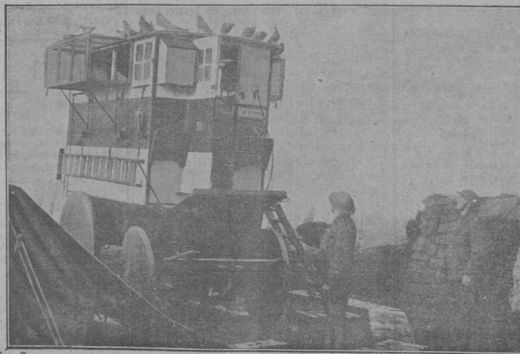
Un palomar inglés