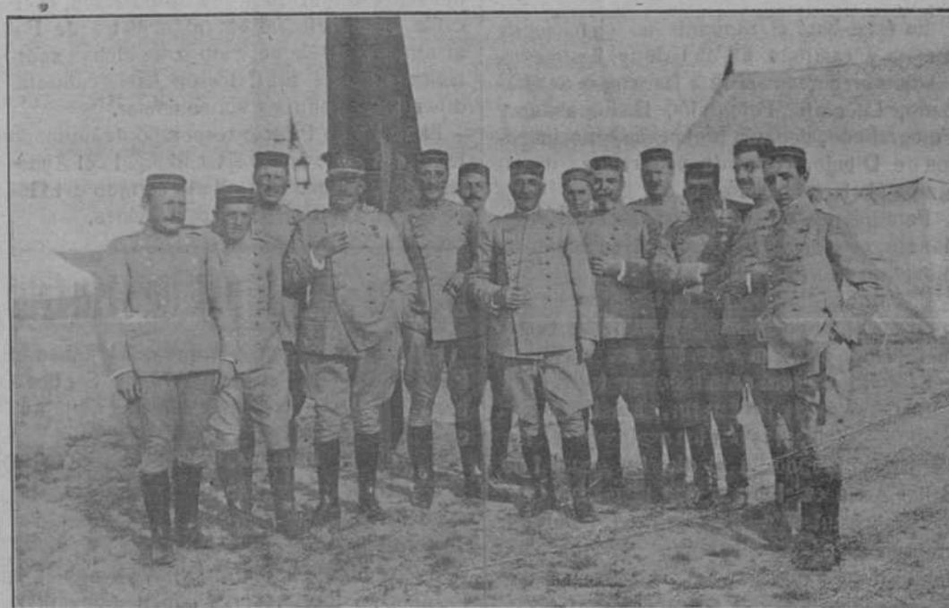
En el campamento