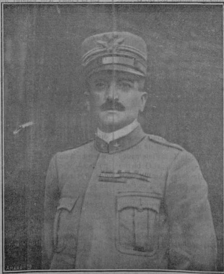
Sig. Armando Díaz, general en jefe de las tropas italianas.

«A unos periódicos de la mañana reproducen, en síntesis, el texto de una hoja suscrita por una entidad denominada Junta Suprema de Correos. En ella se habla del supuesto disgusto existente en el Cuerpo, por razones de índole orgánica, y se anuncia la