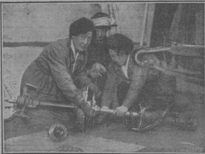
Obreras inglesas arreglando el eje de un automóvil.

Cierto es que conviene mantener vivos el espíritu y la confianza de las masas; pero el sistema de la verdad es más viril y tiende a crear