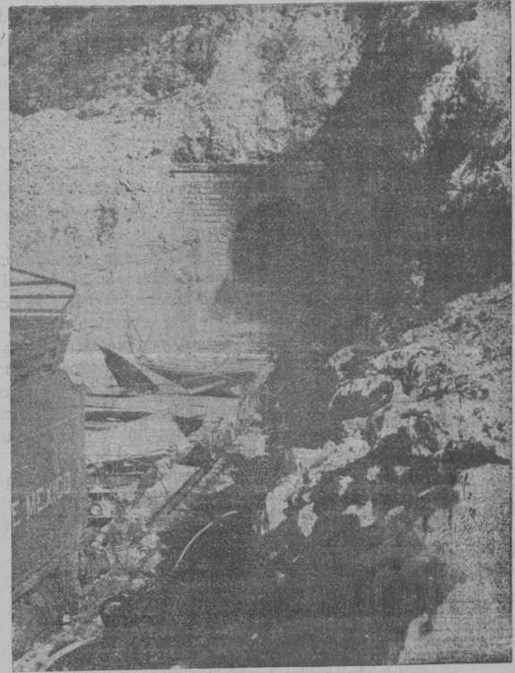
MÉJICO: RESTOS DE UN TREN VOLADO POR LOS INSURRECTOS

Los ladrones se llevaron 1.000 pesetas en billetes del Banco y algunas alhajas y ropas.