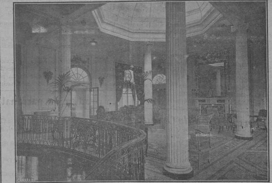
Un aspecto del hall.

Está destinada á suministrar energía para focos y lámparas de alumbrado; extractores eléctricos, ventiladores y Winches para faenas