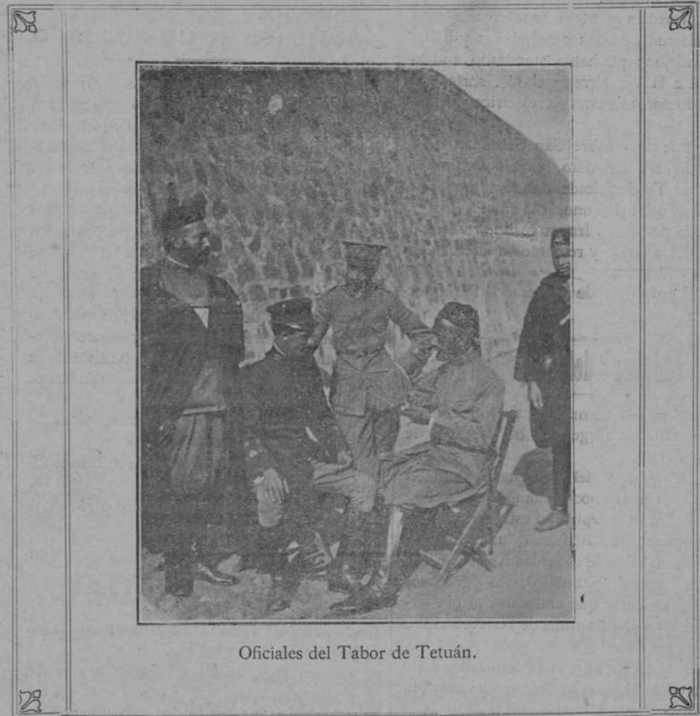
Oficiales del Tabor de Tetuán.

Hoy llegado a Zaragoza es ingresado en la cárcel los cuatro aserradores causantes de la agresión a la benemérita.