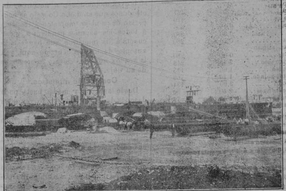
Grúa flotante al costado del «España» con las cajas de humos listas para ser colocadas a bordo.

Tal era el «Hesper's club» que había fundado en la segunda avenida el famo-