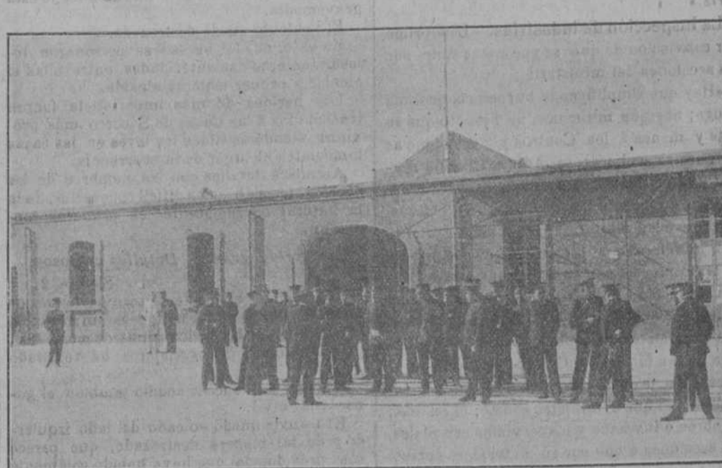
La oficialidad en el patio del cuartel.

tablecer el equilibrio de mi fortuna; pues no es cosa de que las gestiones intempestivas de la Policía vengán á destruirlo todo. En virtud de una reciente indagatoria, resulto hombre peligroso, y aunque ha podido restablecer la verdad, está quebrantada la confianza que inspiraba.