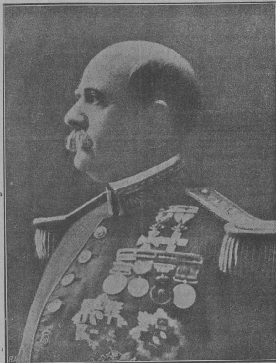
El general de división D. Gabriel Orozco.

Desde la prisión condujole al lugar de la ejecución una pequeña columna, cuya van-