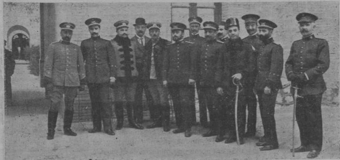
Los defensores de los presos de Cullera.

El maestro de escuela reclutado y pagado como es debido aún no tiene en