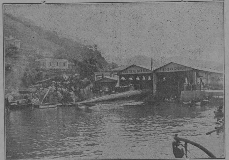
Caída al agua del sumergible italiano «Veilella».

En este combate naval, aunque iguales en