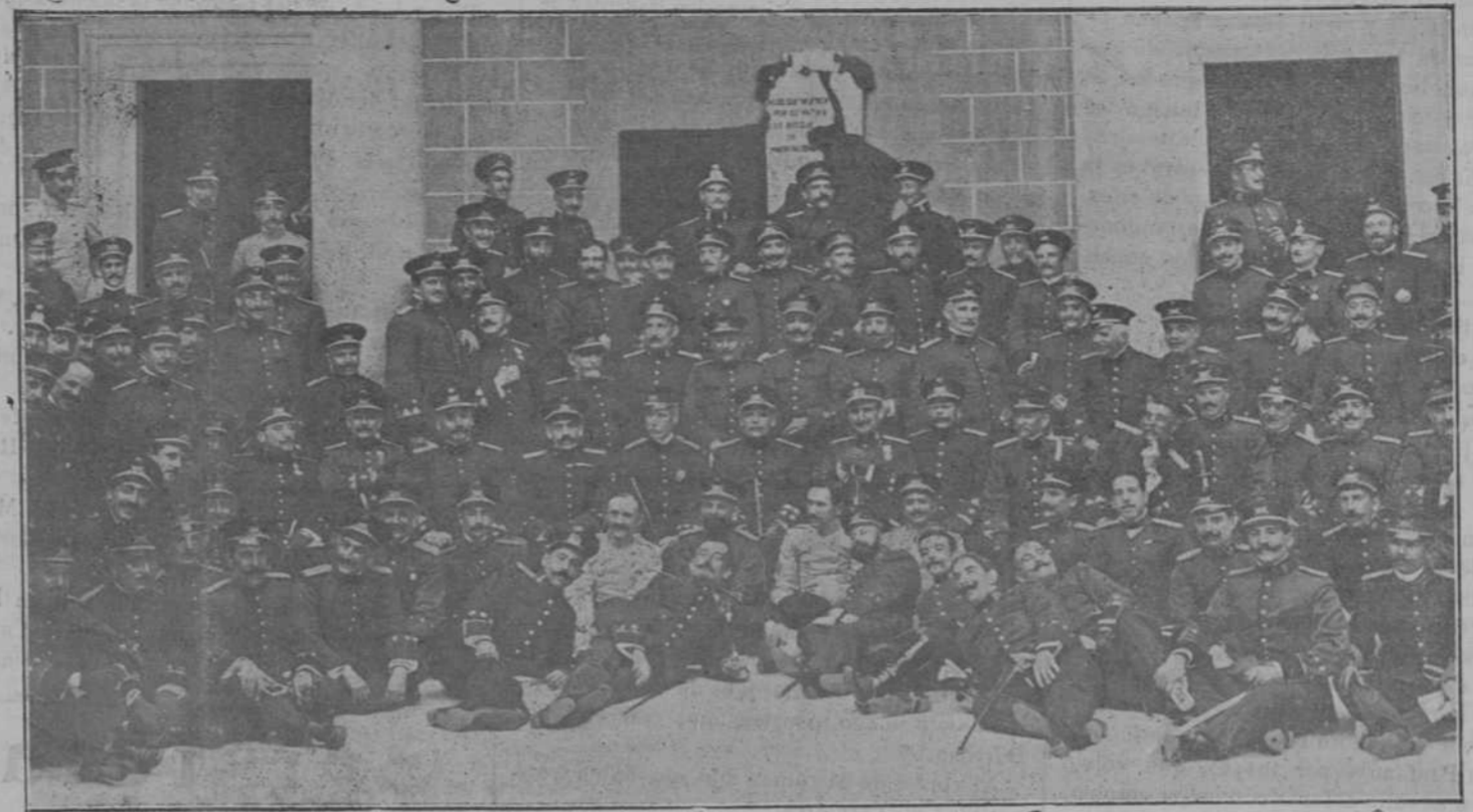
Cuadro formado por el profesorado y capitanes que siguen un curso en la Escuela Central de Tiro y el profesorado de la Academia de Infantería, obtenido en ocasión de visitar los primeros el Alcázar de Toledo.

Cuando estaba a punto de estallar un conflicto obrero, el alcalde convocó a una reunión a Comisiones de obreros y patronos y presentó una proposición encaminada a vencer las dificultades surgidas.