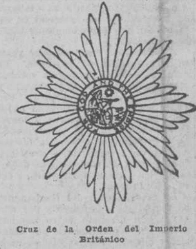
Cruz de la Orden del Imperio Británico

Había que quitar toda traza y reliquia de la Gran Guerra en la residencia oficial del Primer Ministro de Inglaterra en Londres, ya que al ir a firmar en su gran "Salón Dorado" los representantes de los países interesados directamente en los Tratados de Locarno que se quiere que sean de "Seguridad" contra la guerra, la paz debía presidir todo. De ese "Salón Dorado" subdividido durante la guerra mundial, por numerosos tabiques en oficinas de los noticieros periodísticos, salían las noticias oficiales que Inglaterra daba al mundo cuando se trataba de derrocar el poder de Alemania.