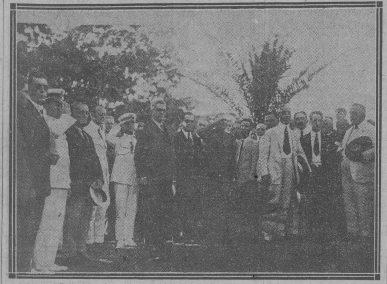
El Presidente de la República y un grupo de concurrentes al acto celebrado ayer ante la estatua de don Tomás Estrada Palma, en el Vedado.