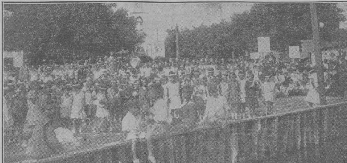
Los niños de ambos sexos del Centro Escolar Juan Alonso Delgado, en el Parque del Surgidero de Batabano.

El día 28 del pasado mes, a las nueve de la mañana, conforme lo indicaba el Presidente de la Junta de Educación en la invitación que hizo al pueblo, en correcta forma-