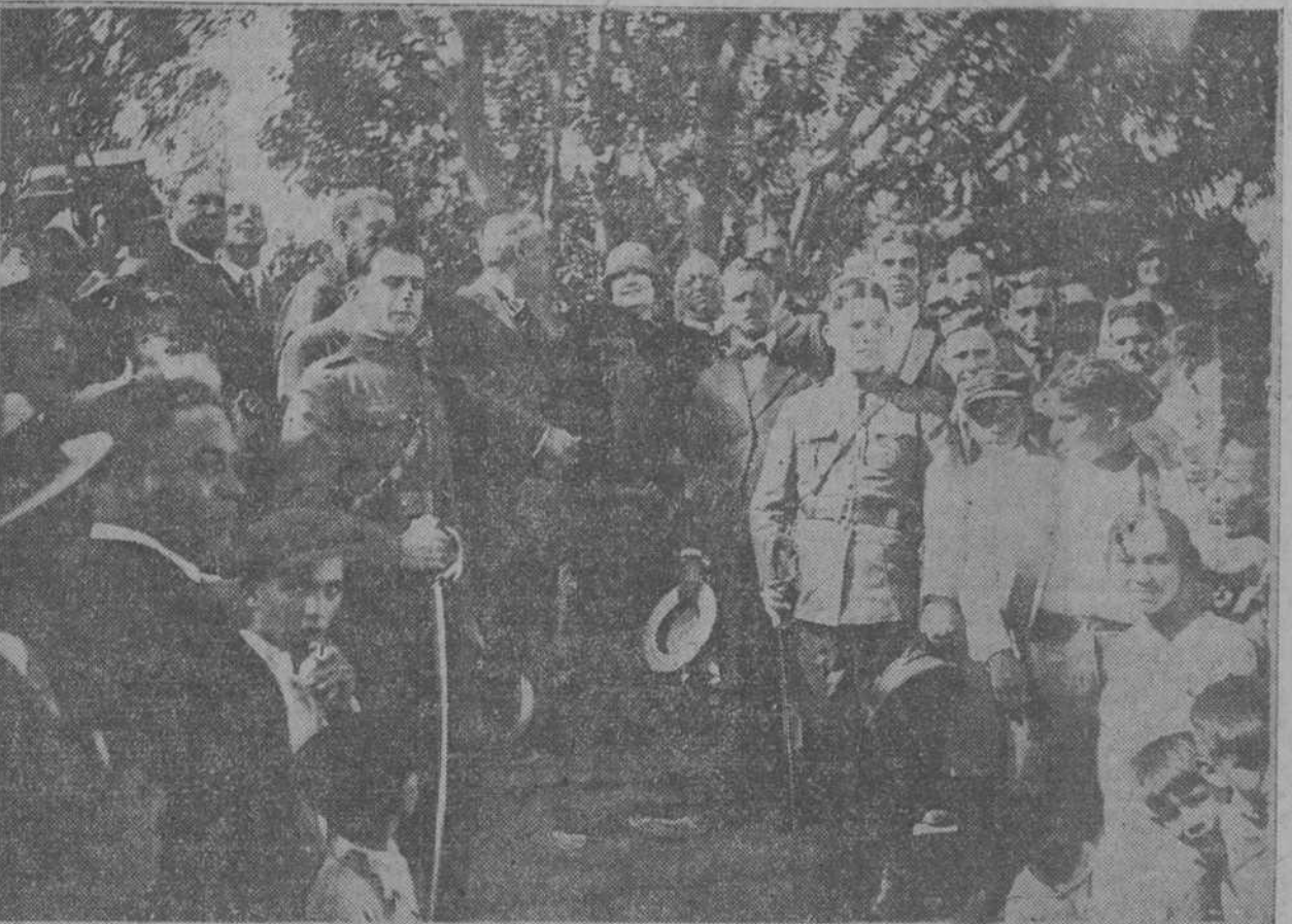
El honorable señor Presidente de la República acompañado por su distinguida esposa en Cacahuatl