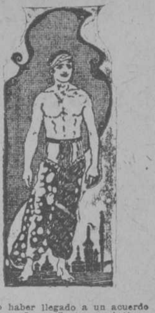
Por no haber llegado a un acuerdo con los señores Santos y Artigas, en cuanto al precio de la localidad, para exhibir en el teatro Capitolio, nuestra famosa película

Repertorio de la GREDEZ FILM CO. HABANA.