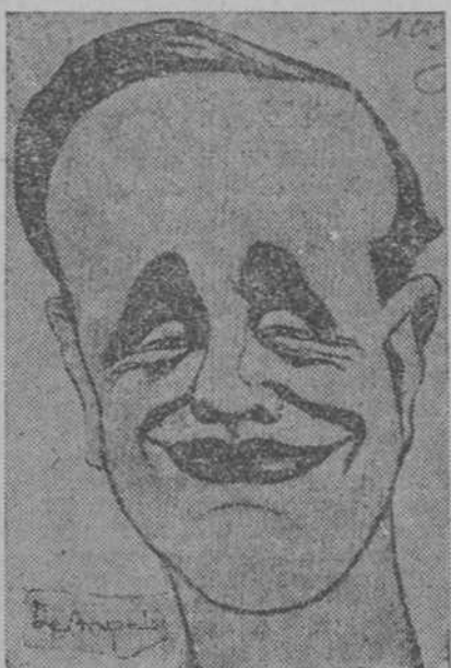
TIRABOSCHI (Caricatura de De Angelis)