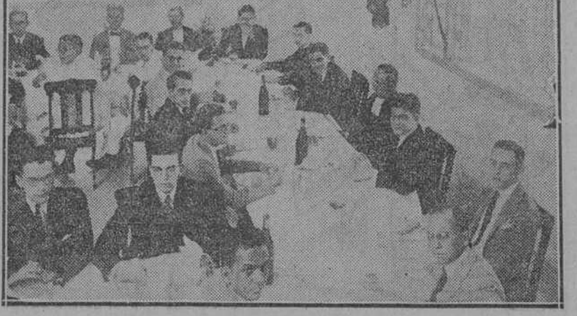
La mesa presidencial en el almuerzo de los Maristas.

Como corresponde a buenos católicos, a las 8 a. m. se reunieron en la sala presidencial en el almuerzo de los Maristas.