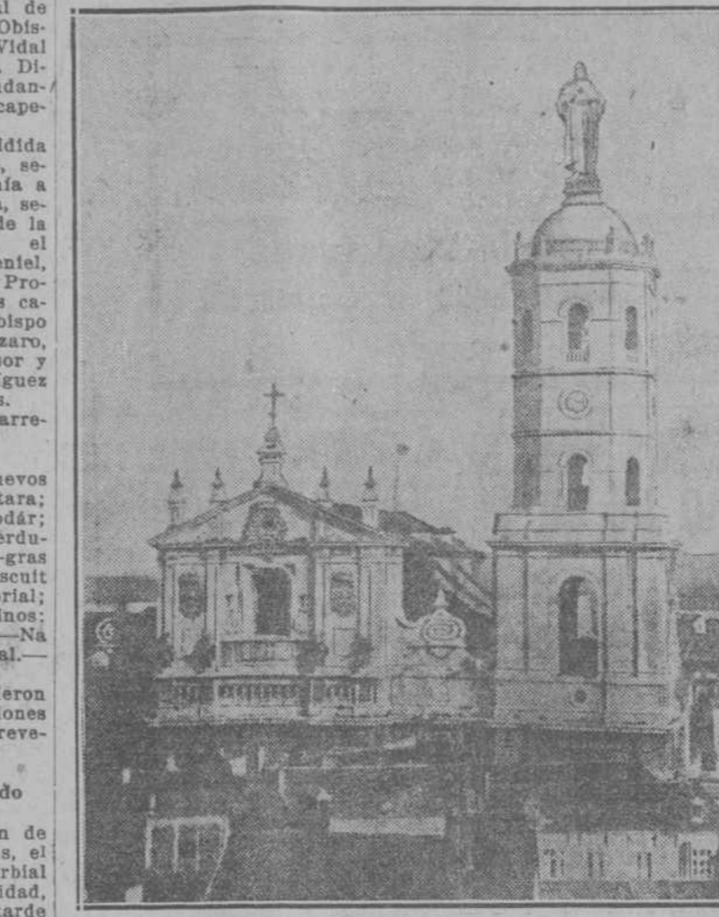
Vista de la torre de la Catedral de Valladolid con la estatua del Corazón de Jesús