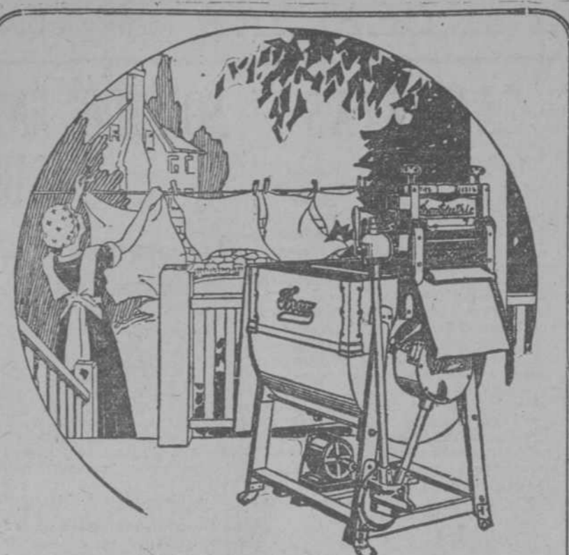
La máquina eléctrica de lavar