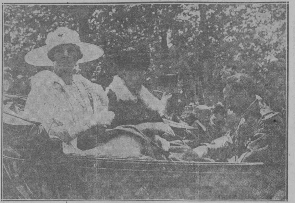
La entrega de la bandera de los Regulares de Ceuta. S. M. la Reina al llegar para presidir el solemne acto.

ocupantes, se estacionaron en parapetos cercanos al Angel Caído, donde no pudieran estorbar las evoluciones de las tropas.