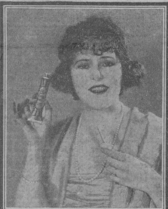
RUTH ROLAND Famosa Estrella de Cine, Dice:

¡Cuidese de las imitaciones! Ipana es absolutamente original en cuanto a su acción, sabor y pureza de su manufactura.