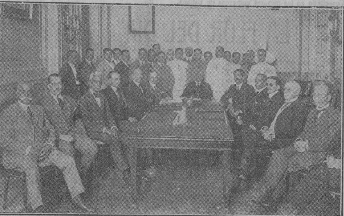
LOS SECRETARIOS ENTRANTES Y LOS SALIENTES REUNIDOS EN PALACIO CON EL JEFE DEL ESTADO PARA LA CEREMONIA DE PRESTAR JURAMENTO A LOS PRIMEROS

EL ORIGEN DEL HECHO El Juez, licenciado Saladrigas radicó la causa por homicidio frustrado, remitiendo al Vivac a Collado por todo el tiempo que marca la ley.