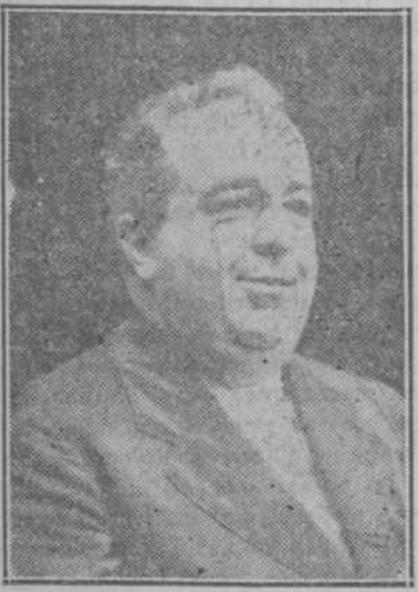
Ofrecimos a continuación uno de los últimos "Charlemos..." que escribió el inolvidable Maestro de los Gritos.