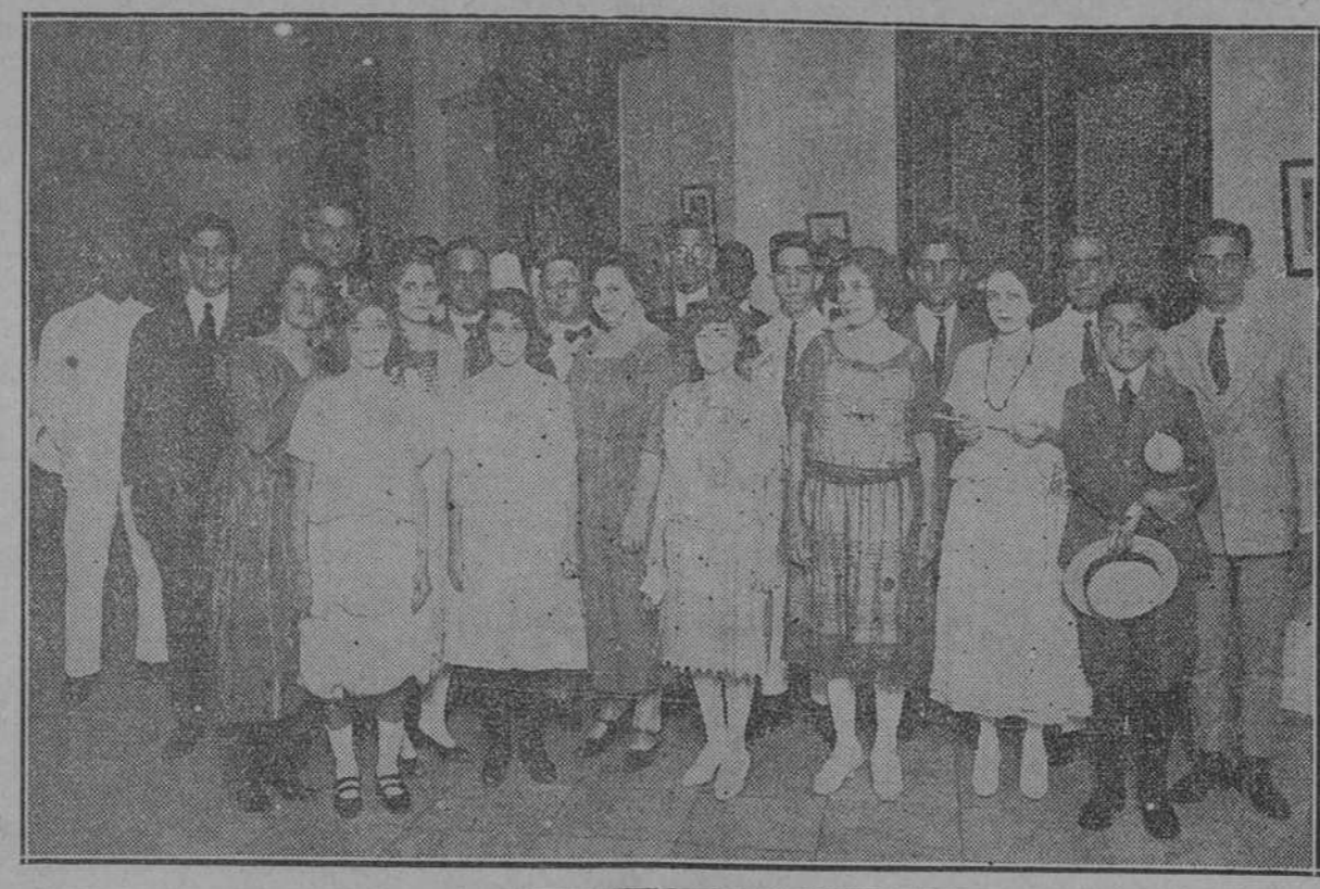
Ayer por la noche recibimos en esta redacción la grata visita de un grupo de interesantes señoritas y jóvenes que forman un coro al que acompañaba una reducida orquesta. DAMOS AGRADECIDOS A LA GRATA VISITA.

HIMNO ORIENTAL NACIONALISTA Orientales, mirad que a la Patria La amenaza el fantasma del mal Mirad cómo mil cuervos pretenden Desgarrar nuestra enseña triunfal! Cuando esclava la Patria gemía Del Oriente surgió la invasión Así surja en vosotros ahora La gran obra de la redención. Deponed todo empeño egoísta Ante el ara de la Libertad y el Bien. Deponed el momento supremo Orientales, a Cuba salvad. Vuestro grito los montes repitan Cuba: Todo lo demos por ti Alejad a los cuervos traidores Que en la sombra os sonde Marrí.