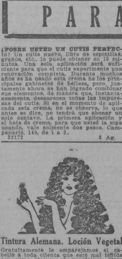
Tintura Alemana. Loción Vegetal