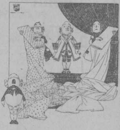
Organdi azul, metro y medio de ancho, colores: lila, nido, jade, abricó, púrpura, rosa, fúch, gris, azul, beige, champagne, arena, cielo, orquídea.

amarillo, fresa, salmón, naranja, pastel, maíz, coral, prusia, carmelita y henna a 55¢.